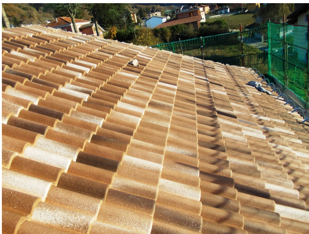
Sistemi di isolamento a cappotto